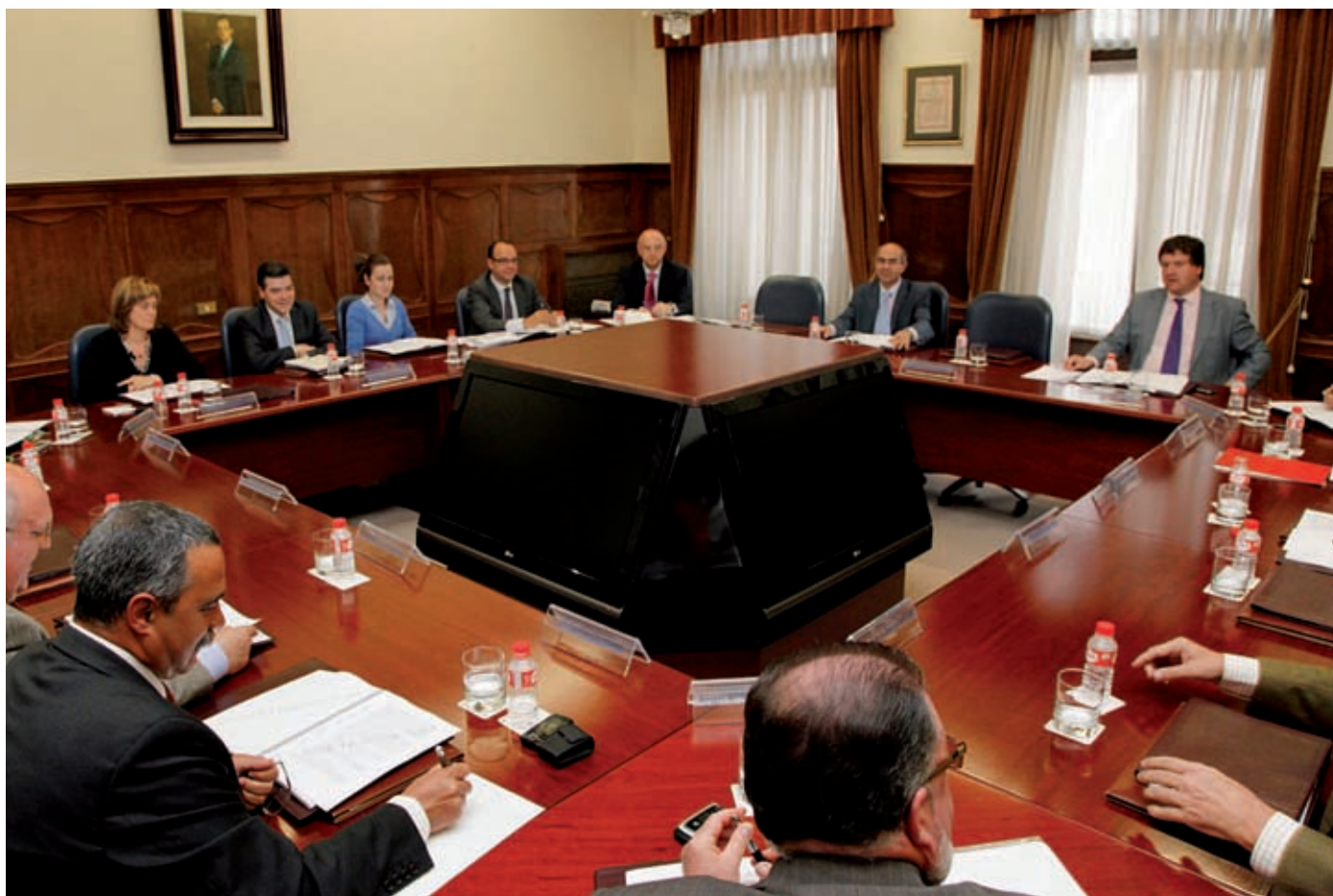
Consejo de Administración de Caja Cantabria